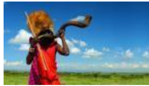
马赛马拉大平原上的马赛人